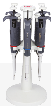
Statyw karuzelowy (Nr kat. 5484)