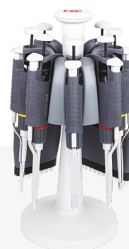
Statyw wielostanowiskowy (Nr kat. 5449)