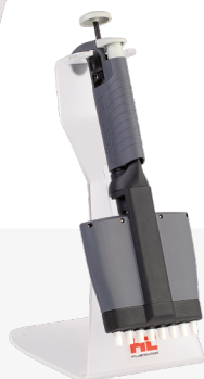
Statyw 1-stanowiskowy plexi (Nr kat. 5479)